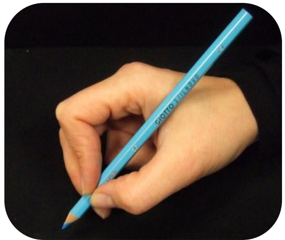
Le haut du crayon est posé dans le creux entre le pouce et l'index.