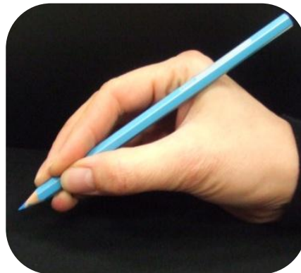
Majeur sur le crayon