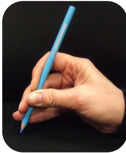
Tous les doigts au dessus et le pouce en opposition