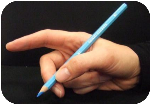
Ce n'est pas l'index qui pince, il dirige.

Les doigts ne sont ni trop près, ni trop loin de la mine.