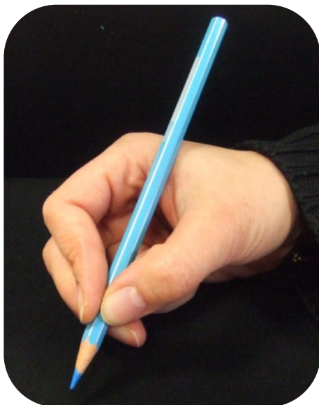
Le crayon est posé sur la première phalange du majeur.