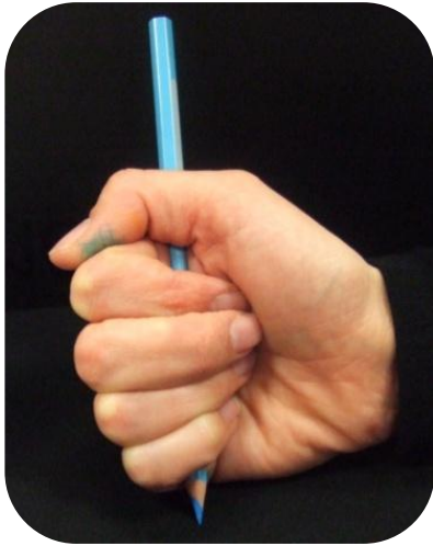
Crayon tenu par tous les doigts